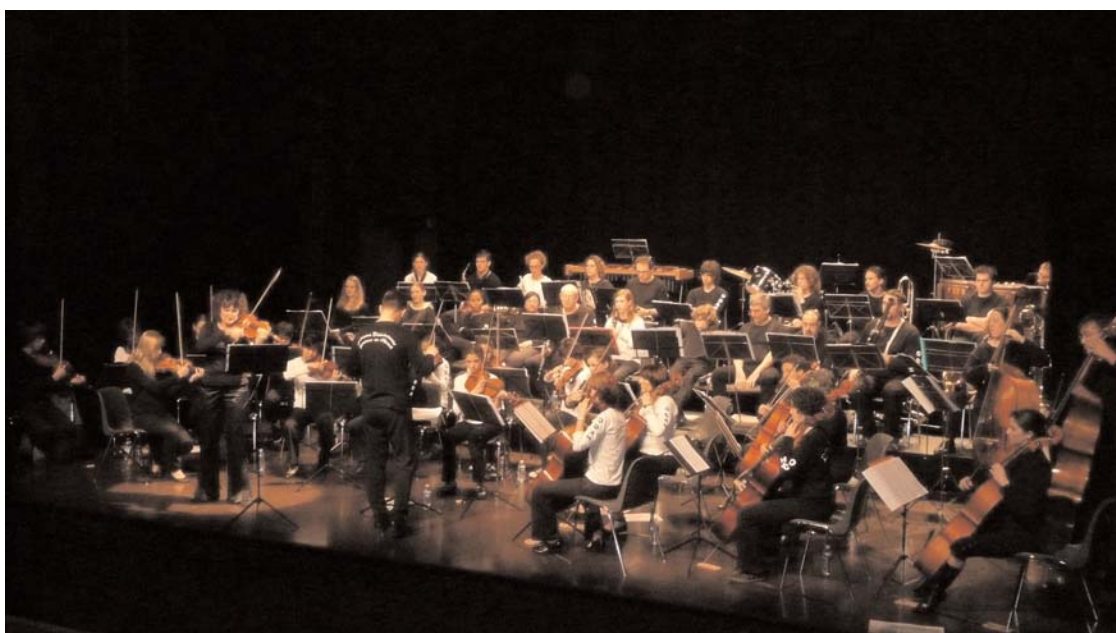
Concert de l'ODAH, Mauguio, 11 avril 2009.

(les lieux des concerts vous seront précisés prochainement).